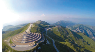
Monte Grappa, da Semonzo